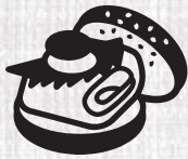
ライスバーガー Rice burger

100% made with carefully selected rice from Kyushu, our mixed grain rice burger set.